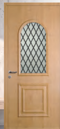
Réf. Costa 8 - Grille G007