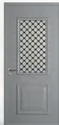
Réf. Gispana 125 - Grille G004