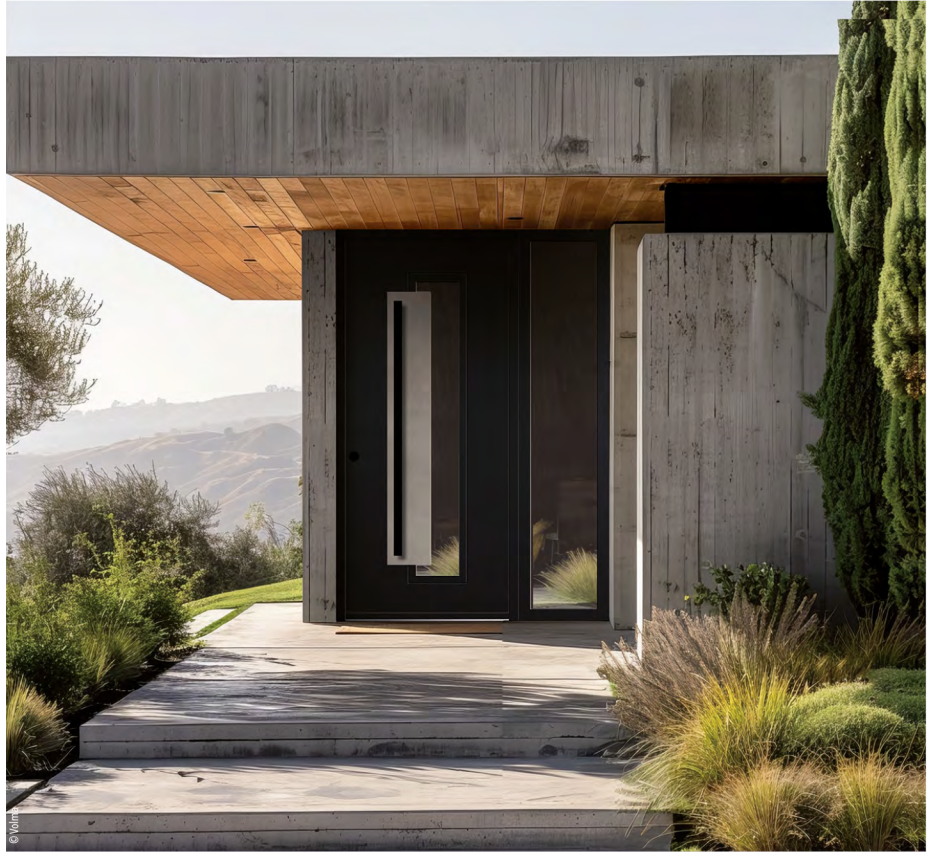
© Volma Pharell avec insert céramique, signée Volma