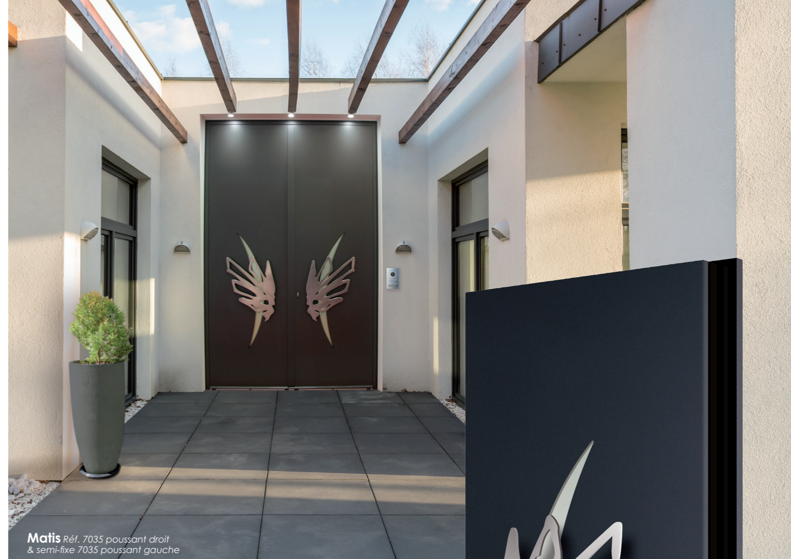
Matis Réf. 7035 poussant droit & semi-fixe 7035 poussant gauche