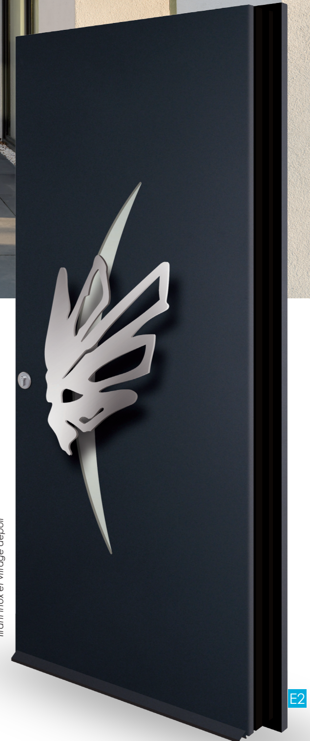
Matis Réf. 7035 Tirant inox et vitrage dépoli

L'inox 316L est un acier inoxydable hautement résistant à la corrosion. De 8 mm d'épaisseur, il fait preuve d'une robustesse à toute épreuve. Matériau noble, il capte la lumière avec délicatesse pour sublimer chaque courbe de ces designs inventifs. Véritable pièce d'ornement, les tirants de la collection LOFT élévation seront le point central et magistral de votre entrée !