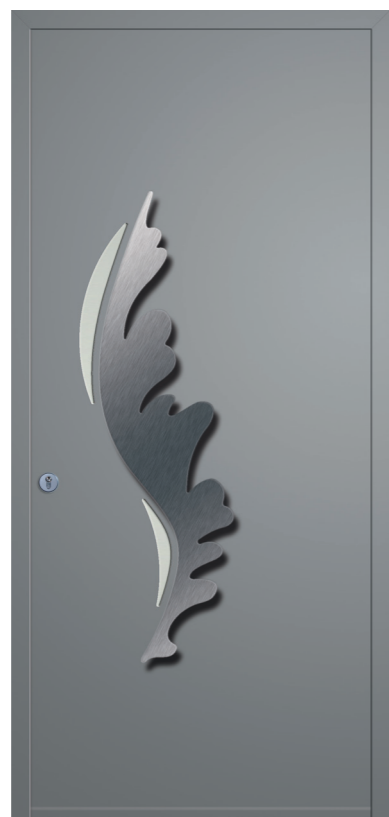
Plume Réf. 7085 Tirant inox et vitrage dépoli Rainurage face intérieure