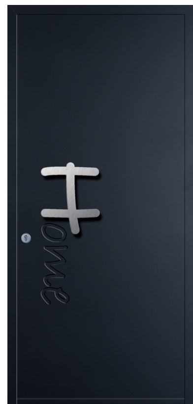
Home Réf. 7083 Tirant inox et rainurage Face intérieure lisse