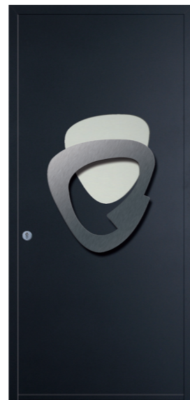
Luna Réf. 7039 Tirant inox et vitrage dépoli Rainurage face intérieure