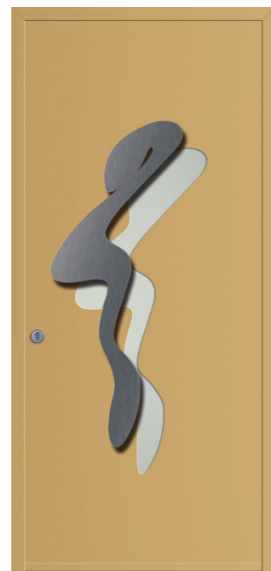
Gaspar Réf. 7037 Tirant inox et vitrage dépoli